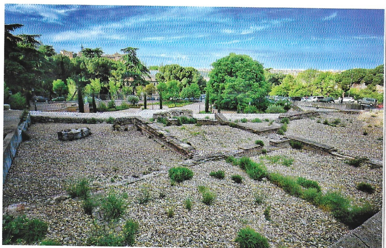
Plaza del emir Mohamed I.