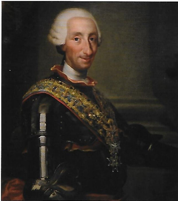
Retrato de Carlos III.

entusiastas, les daban la bienvenida. Con el fin de cumplimentar a los soberanos, el aspecto de la capital hubo de mejorarse. Así, de los balcones pendían colgaduras y aquí y allá se habían colocado paneles decorados y banderolas. Como el Palacio Real se encontraba aún en obras, se dirigieron a la Puerta del Sol por la calle de Alcalá. Desde allí se trasladaron a la iglesia de Santa María de la Almudena, donde se celebró un Te Deum . Tras ello los monarcas tomaron el camino de regreso al punto de partida, pasando antes por la Plaza Mayor y por la Carrera de San Jerónimo.