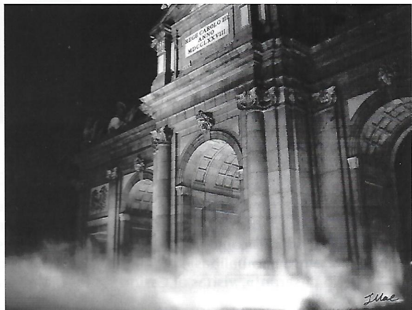
Imagen nocturna de la Puerta de Alcalá.

Así que con el objetivo final de que la población madrileña mejorase su situación económica, a través de la cul-