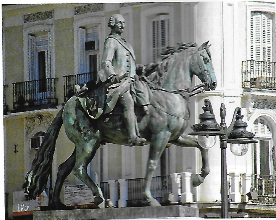
Monumento a Carlos III en la Puerta del Sol.