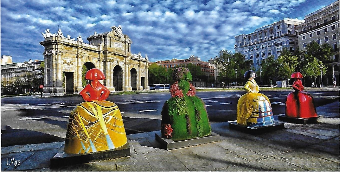
Meninas decorativas junto a la Puerta de Alcalá.

un mundo de tinieblas. Su idea era luchar contra todo ello mediante la cultura, el desarrollo de la ciencia y el uso de la razón.