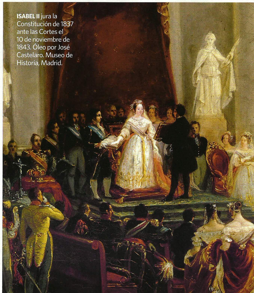
ISABEL II jura la Constitución de 1837 ante las Cortes el 10 de noviembre de 1843. Óleo por José Castelar. Museo de Historia, Madrid.

La verdad es que Isabel II no tuvo un reinado fácil. La inestabilidad política fue una constante, al igual que la corrupción. Fue un período de transición en el que la monarquía cedía poder político al parlamento y en el que los pocos cambios que se daban en la escena política llegaban de la mano de pronunciamientos militares. La personalidad de la reina, poco apta para las tareas de gobierno, no contribuyó tampoco a serenar el ambiente. Pérez Galdós la des-