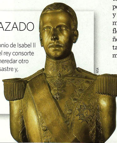
FRANCISCO DE ASÍS DE BORBÓN. BUSTO. MUSEO DEL EJÉRCITO, MADRID.

LA POLÍTICA llevó a concertar el matrimonio de Isabel II con su primo Francisco de Asís, ya que el rey consorte debía ser noble, pero no tener opción a heredar otro trono europeo. El matrimonio fue un desastre y, ya en el exilio, se separaron (Francisco, carlista, había conspirado contra su esposa, e incluso llegó a chantajearla con lo que sabía de sus amantes).