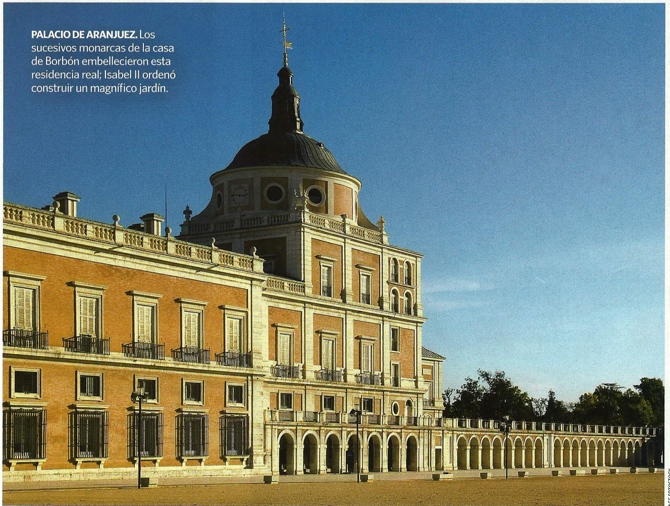
PALACIO DE ARANJUEZ. Los sucesivos monarcas de la casa de Borbón embellecieron esta residencia real; Isabel II ordenó construir un magnífico jardín.

que trajeran de la cocina todos los sacos de garbanzos que pudiesen cargar y los tirasen por la escalera. El efecto no se hizo esperar: los asaltantes no pudieron seguir avanzando y se vieron vencidos por unas sencillas legumbres. El acto tuvo consecuencias funestas para Diego de León, que murió fusilado. Espartero, tachado de inflexible por este y otros actos, perdió el favor popular y un